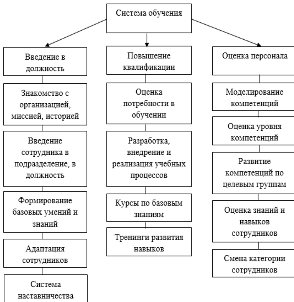
Рисунок 1. Система обучения персонала

Если обучение проводят с целью повышения квалификации, то сюда относятся следующие задачи: для начала происходит выявление потребности в обучении, а затем составляются программы обучения и сотрудников, которым необходимо обучение направляют на различные курсы и тренинги.