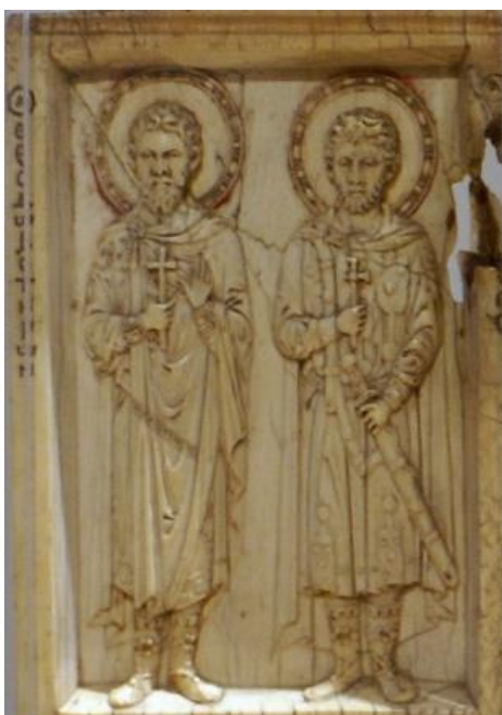
Рис. 8. Свв. Феодор Тирон и Евстафий. Фрагмент триптиха из Палаццо Венеция в Риме

Святые воины чаще изображались в воинском одеянии с оружием, однако встречается также мученический тип — с крестом в руке. Так, на византийском резном триптихе из слоновой кости с Деисусом и святыми (Палаццо Венеция, Рим), заказчиком которого, вероятно, являлся византийский император Константин VII Багрянородный (945–959), представлены ростовые фигуры нескольких святых воинов, среди которых есть оба Феодора: Тирон (рис. 8) и Стратилат (рис. 9) изображены с крестом в правой руке у груди, но в отличие от Тирона у Стратилата в левой руке меч [14; 12, р. 78–80, ill. 1]. Кроме того, заметно отличие в форме прически: у Стратилата более длинные волосы, прикрывающие уши, а у Тирона волосы короче и уши открыты. Если датировка создания данного триптиха последними годами правления Константина Багрянородного верна, то на нем нашли отражение одно из самых ранних сохранившихся изображений св. Феодора Стратилата, а также одни из первых фиксаций в искусстве обозначений «Тирон» и «Стратилат».