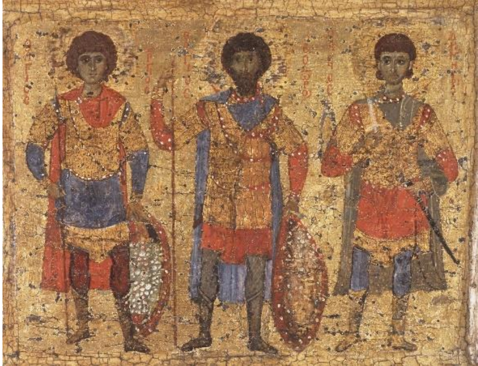
Рис. 6. Святые воины Георгий, Феодор и Димитрий. Икона. Государственный Эрмитаж, Санкт-Петербург