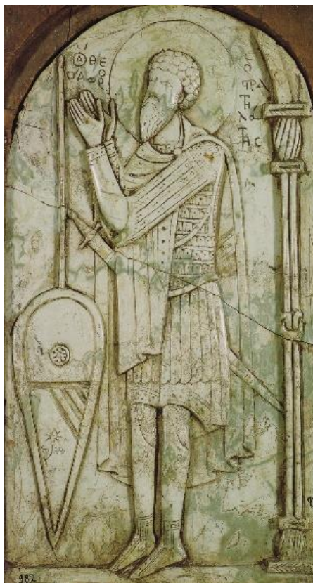
Рис. 11. Св. Феодор Стратилат. Иконка из музея Ватикана

Стратилата может быть и нераздвоенная борода — например, на мозаике XI в. из Неа Мони на Хиосе (рис. 5) и на фрагменте иконы XI в. из Музея Ватикана (рис. 11) [5, p. 157–158, cat. 104].