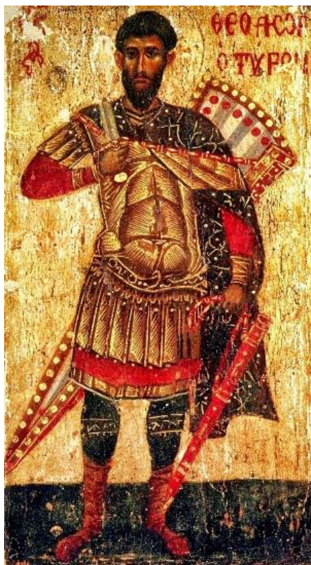
Рис. 4. Св. Феодор Тирон. Икона из монастыря Иоанна Богослова на Патмосе