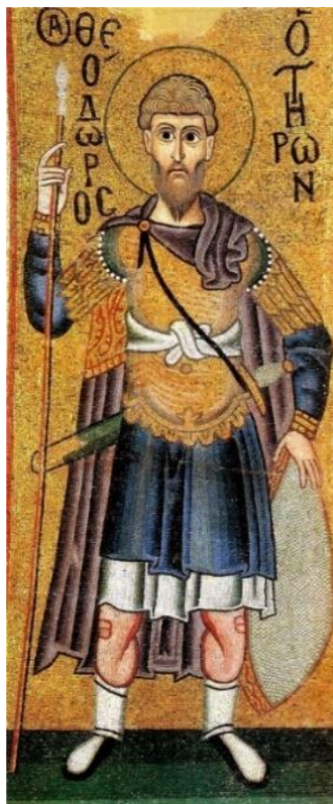
Рис. 2. Св. Феодор Тирон. Мозаика кафоликона монастыря Осиос Лукас в Фокиде