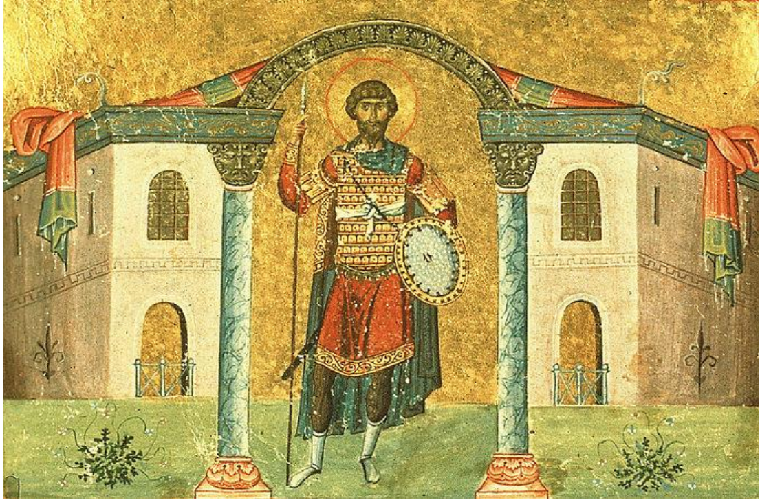
Рис. 10. Св. Феодор Стратилат. Миниатюра из Минология Василия II

Анализ ранних изображений показывает, что в период с середины X в. и до середины XI в. происходило формирование иконографического типа Феодора Стратилата и вырабатывались характерные черты, отличающие его от Феодора Тирона, что отразилось в изображениях на триптихе из Палаццо Венеция и в Императорском Минологии. М. Маркович отметил, что появление св. Феодора Стратилата привело к изменению традиционного облика св. Феодора Тирона в виде средовека с усами и остроконечной бородой. Тирон стал изображаться с прической как у св. Димитрия — с короткими и густыми волосами, зачесанными за уши или подстриженными над ними, а его густая борода закруглена или собрана в несколько прядей. Стратилат получил прическу как у св. Георгия — с густыми курчавыми волосами, закрывающими уши, его борода чуть более короткая, обычно завершающаяся двумя остроконечными прядями [7, с. 621]. Следует учитывать, что хотя раздвоение бороды более характерно для иконографии Феодора Стратилата, но иногда встречается и у Феодора Тирона, например, на двух его изображениях на мозаиках из кафоликона монастыря Осиос Лукас в Фокиде (рис. 1; 2) [8, р. 53, 54, fig. 48, 49]. В свою очередь, у