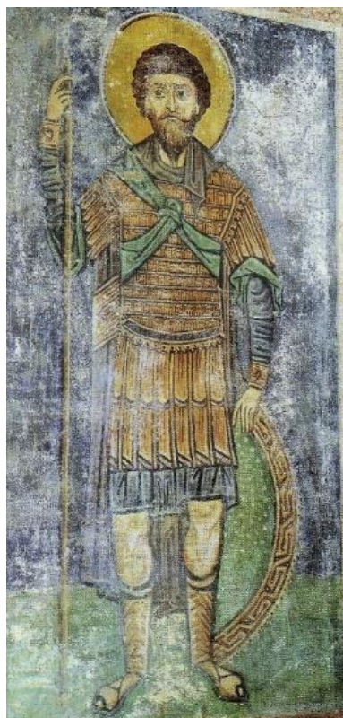
Рис. 3. Св. Феодор Стратилат. Фреска кафоликона монастыря Осиос Лукас в Фокиде