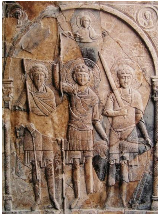
Рис. 7. Святые воины. Иконка из Заповедника «Херсонес Таврический»