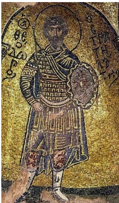
Рис. 5. Св. Феодор Стратилат. Мозаика кафоликона монастыря Неа Мони на Хиосе

Однако, сомнительно, чтобы все без исключения изображения св. воина Феодора без конкретизирующей надписи, датируемые периодом с середины X в. и до конца XII в., были «Тиронами». Возможно, что в некоторых случаях, когда иконография лика соединяет в себе черты обоих святых, художники в образе св. Феодора объединяли две личности — Тирона и Стратилата, поскольку их часто путали. В других случаях в изображениях св. Феодора очень ярко проявляются отличительные признаки Стратилата, в частности характерная для него прическа в форме своеобразной шапки из пышных курчавых волос, закрывающей уши, например, как на двух иконах: «Апостол Филипп, св. Феодор и св. Димитрий» (начало XII в.) [4, с. 26, кат. 469] и «Святые воины Георгий, Феодор и Димитрий» (конец XI – начало XII вв.) (рис. 6) [4, с. 28, кат. 471; 5, р. 122–123, cat. 69]. Некоторые специалисты на основе особенностей иконографии ликов святых воинов, представленных на второй из двух упомянутых выше икон, определяют, что на стеатитовой иконке XII в. из Заповедника «Херсонес Таврический» также изображены свв. Феодор Стратилат, Георгий и Димитрий, хотя соответствующие надписи на ней отсутствуют (рис. 7) [5, р. 300–301, cat. 203].