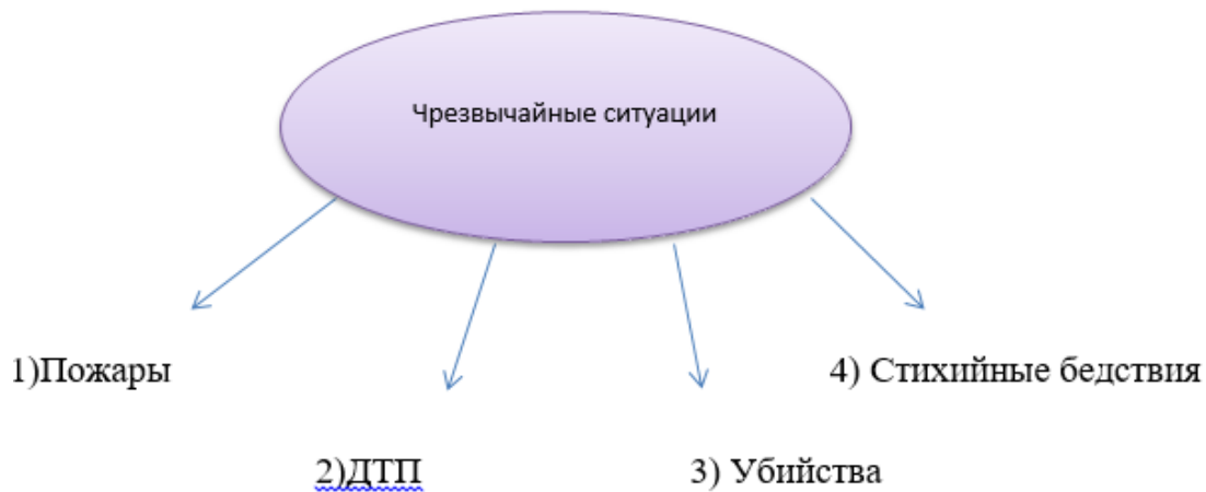
Рисунок 1. Виды чрезвычайных ситуаций

информацию?», 69% россиян (среди молодых – три четверти) признают, что есть такие общественно важные проблемы и темы, информацию о которых допустимо умалчивать в государственных интересах. Остальные считают, что есть темы, при освещении которых допустимо искажение информации в государственных интересах. Чаще всего среди таких тем называют сведения об эпидемиях («с коронавирусом можно скрыть») и вопросы обороны («военные темы, военные разработки оружия») [4].